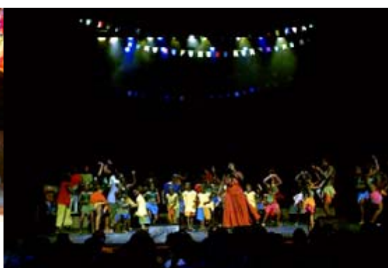
"Jongo da Serrinha"